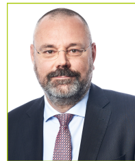
Ottmar Wernicke Haus & Grund Württemberg